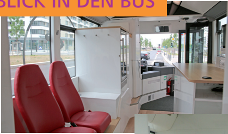
Anmelde- und Wartebereich