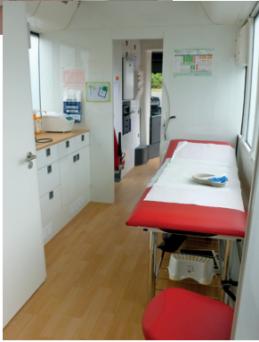
Labor- und Behandlungsbereich